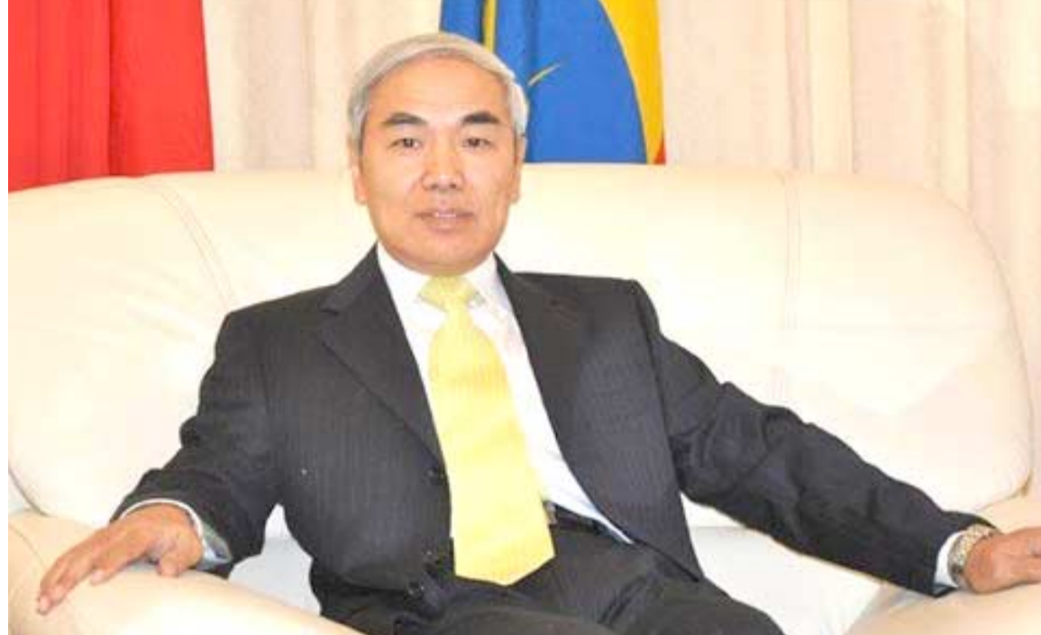
السفير شياو بان المبعوث الصيني الخاص إلى سوريا

□ وكيف ترى تأثير الهجوم الكيميائي والذي تسبب في مقتل المئات من المدنيين في حلب وأدى إلى زيادة حدة التوتر والتفكير في الأزمة ؟ - نحن نرفض بشدة استخدام السلاح الكيماوي في أي من الأطراف تحت أي ظرف وفي أي مكان وفي أي زمان الا أننا نرى ضرورة تحقيق عادل ومستقل ونزيه ومهني في تلك القضية لتحديد الجناة والقبيض عليهم وادانتهم وفقاً للقانون والمعاهدات الدولية، لكن الأمر يتطلب أن يكون هناك تشكيل فريق التحقيق في معظم المناطق السورية بعد اجتماع الاستانته الذي حضرته روسيا وتركيا وإيران كما أصبح هناك إجماع من المجتمع الدولي والأطراف ذات الصلة بالأزمة بأنه